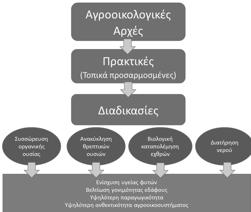
Εικόνα 3. Αγροοικολογικές αρχές για τη μετατροπή γεωργικών συστημάτων (τροποποιημένο από Nichols et al. [12] )

Είναι επίσης σημαντικό να λαμβάνεται υπόψη πως η Αγροοικολογία δεν θεωρείται τόσο μια ξεχωριστή προσέγγιση και σύστημα διαχείρισης, αλλά μια “ομπρέλα” εννοιών και αρχών, με σημαντική αντιστοίχιση προς άλλες προσεγγίσεις που στοχεύουν στην επίτευξη της γεωργικής αειφορίας και προσφέρουν εναλλακτικές δομές στο κυρίαρχο πρότυπο της βιομηχανικής γεωργίας. Τέτοιες προσεγγίσεις είναι η βιολογική και βιοδυναμική γεωργία, η αγροδασοπονία, η γεωργία χαμηλών εισροών, η πολυλειτουργικότητα στη γεωργία, η αεικαλλιέργεια (περμαουλτούρα) η βιολογική καταπολέμηση εχθρών των καλλιεργειών κ.α.