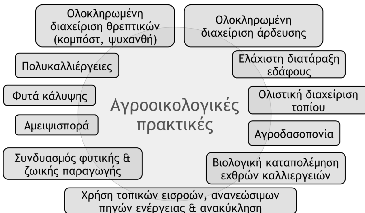
Εικόνα 4. Αγροοικολογικές πρακτικές

καινοτομίας (περιλαμβάνοντας ισοδύναμα τη τοπική αγροτική γνώση όσο και την παγκόσμια επιστημονική), iv) την υπεύθυνη διακυβέρνηση, καθώς και οικονομικές / πολιτικές προσεγγίσεις